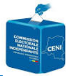
Illustration inscription sur le verso de la photo